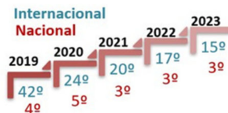
Ranking Web of repositories

Idus superó con éxito evaluación de repositorios institucionales de investigación , realizada en junio de 2017 por el Grupo de Trabajo de Repositorios REBIUN. En ella se certificó que cumplía 23 de los 25 criterios definidos en la Guía editada por REBIUN/FECYT en 2014. Posicionándose en el grupo de los 8 mejores repositorios institucionales de los 28 evaluados hasta la fecha.